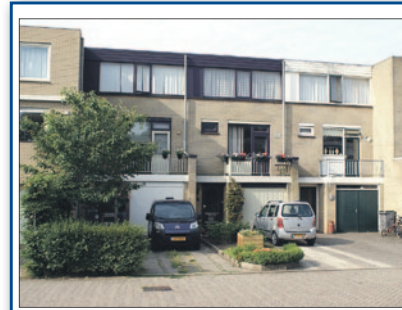
Koperslagerstraat 42 Huissen Vraagprijs € 169.500,- k.k.