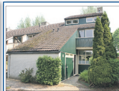
Landpaal 10 Huissen Vraagprijs € 165.000,- k.k.