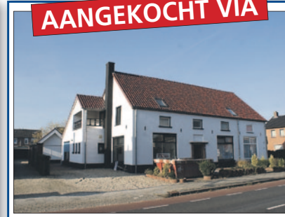
Dorpsstraat 39 Gendt