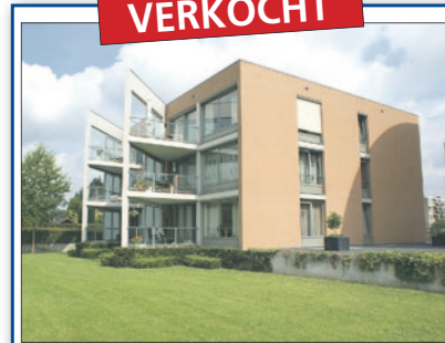
Dillenburg 10 Huissen Vraagprijs € 265.000,- k.k.